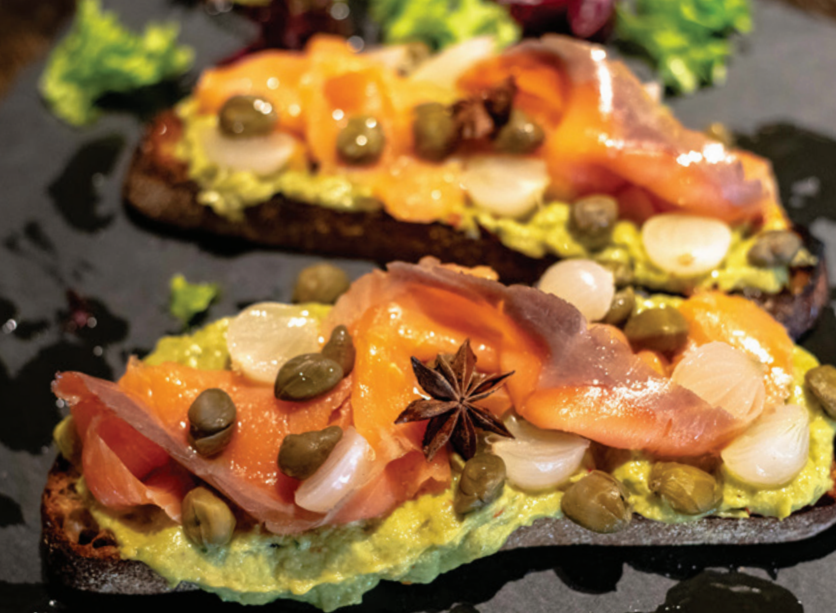
Hit: Sendvič sa dimljenim lososom i avokadom