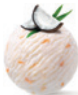
Raffaello - 180

Sladoled mlečnog ukusa sa prelivom od hrskave crne čokolade