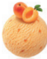
Jogurt kajsija - 180

Vaniia iz oblasti Madagaskar. Tradicionaini ukus jaceg intenziteta