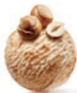
Lešnik - 180

Sladoled od posebne vrste lešnika iz regije Piemonte U Italiji