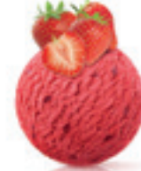
Jagoda - 180

Veliki procenat bobicastog savršenstva, bez mleka