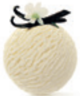
Vanila Madagaskar - 180

Sladoled od posebne vrste lešnika iz regije Piemonte U Italiji