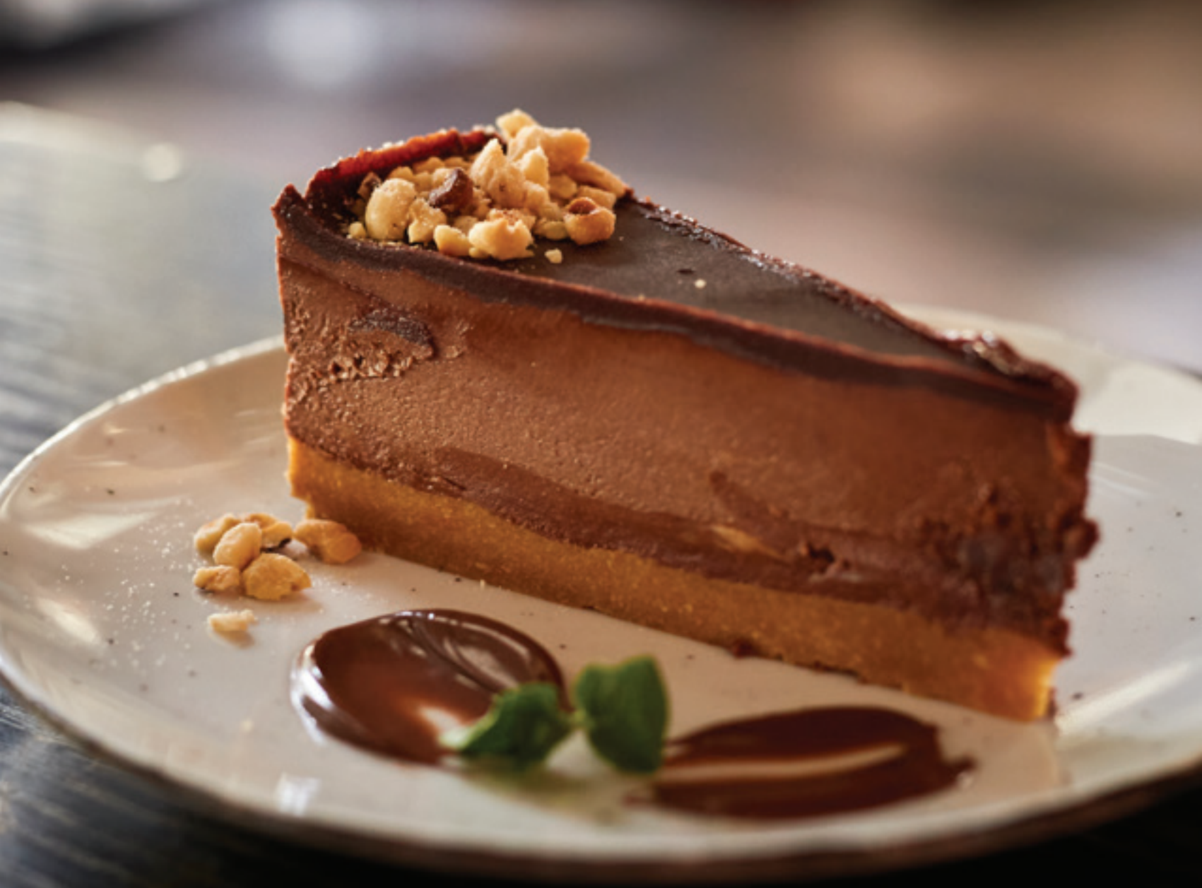
Prosto neodoljiva - Nutela torta