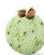
Pistać 100% - 180

Najfiniji kokos sa belom čokoladom i hrskavim vaflom