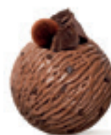
Čokolada - 180

Za najzahtevnije sladokusce, pečeni pistać 100%