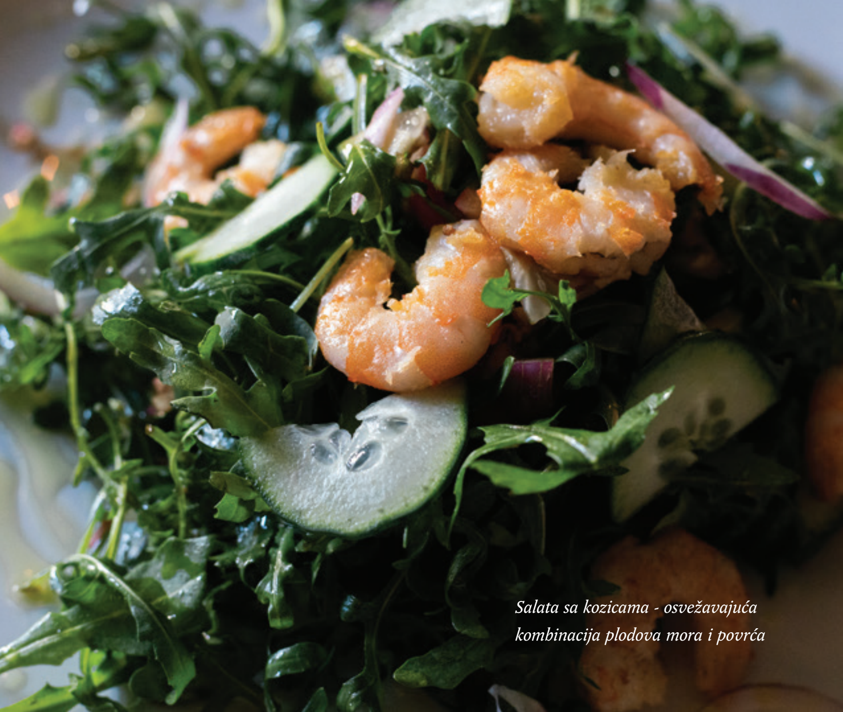
Salata sa kozicama - osvežavajuća kombinacija plodova mora i povrća